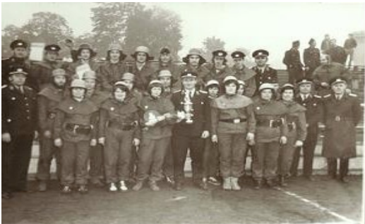
Kameradinnen der FFW nach einem Pokalsieg