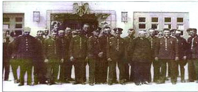
Michendorfer Feuerwehrleute um 1940 Lehrgang der Feuerlöschpolizei in Potsdam