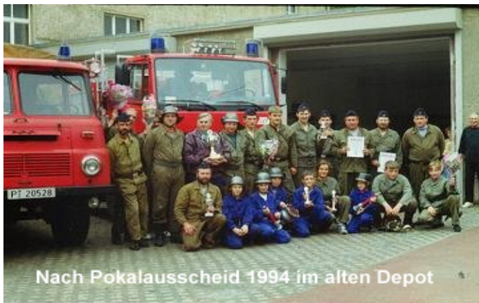
Nach Pokalausscheid 1994 im alten Depot