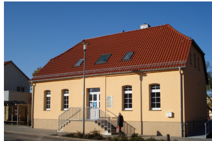
Potsdamer Straße 57

Die Mühle ist zu erreichen: Eingang Langerwischer Straße